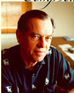
Joseph Campbell (1904–1987)

JOSEPH CAMPBELL var professor i mytologi och jämförande litteratur vid Sarah Lawrence College, New York. Han skrev och redigerade ett tjugotal böcker, däribland The Masks of God (fyra volymer 1959–1968), The Mythic Image (1974) och The Historical Atlas of World Mythology (1983).